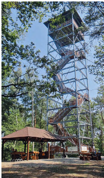
Wieża widokowa na Szpilówce

10.5 D Kąty, Dwór Stawików, ławka Jana Karskiego – w miejscowości