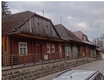
Drewniana zabudowa w Zakliczynie

0,0 A Zakliczyn – startujemy z rynku. Cechą charakterystyczną tego klimatycznego miasteczka, która przez wieki nadawała mu oryginalny charakter, jest zabudowa w postaci drewnianych, parterowych domów o specyficznej konstrukcji „dziewięciosłupowej”. Budynki stawiano szczytami do drogi, zwieńczone są dachami naczółkowymi, z okapami wydatnie wysuniętymi nad chodniki.